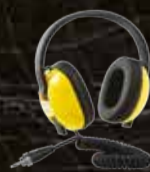
वाटरप्रूफ कोस हेडफोन