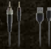
वायरलेस हेड फोन्स ऐक्सेसरीज़ - ऑडियो केबल और चार्जिंग केबल