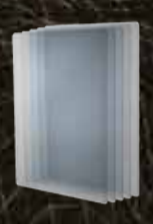
5 x स्क्रीन प्रोटेक्टर