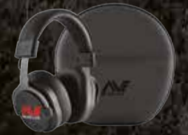
कम अव्यक्ता वायरलेस हेडफोन केरी केस के साथ