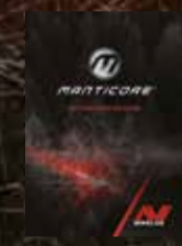
शुरू करना मार्गदर्शिका