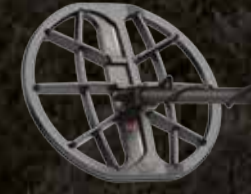
स्कैडिप्लेट के साथ M11 कॉइल 11 " राउंड डबल-डी - 5 मीटर (16 फीट) तक वाटरप्रूफ